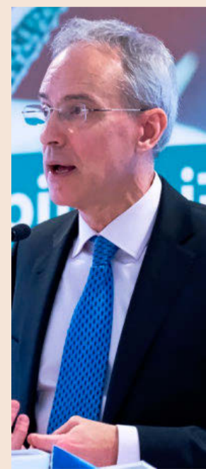
Jesús Gascón, director de la Agencia Tributaria.

Además, Gascón adelantó que se van a ingresar más de 15.000 millones por la lucha contra el fraude en 2018, un aumento de, al menos, el 2% respecto a los 14.792 millones de 2017, tras dos ejercicios de caída.