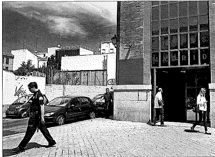
Una de las sedes de Google en Madrid registrada por Hacienda, en junio de 2016.

Desde la Agencia Tributaria han aumentado el control sobre estas empresas globales, que se sirven de sus filiales para trasladar los beneficios a lugares con los impuestos más bajos. La estrategia comienza a dar resultados. El año pasado, la ONFI participó en 189 comprobaciones inspectoras, casi un 60% más que el año anterior. A finales de 2016 había finalizado casi la mitad de las actuaciones iniciadas (93) que supusieron ajustes, en base a la imponible de unos 2.500 millones de euros respecto a actuaciones meramente presenciales. A esta cantidad habría que añadir otros 1.200 millones en actuaciones donde la ONFI ha tenido una participación fundamental en el asesoramiento y