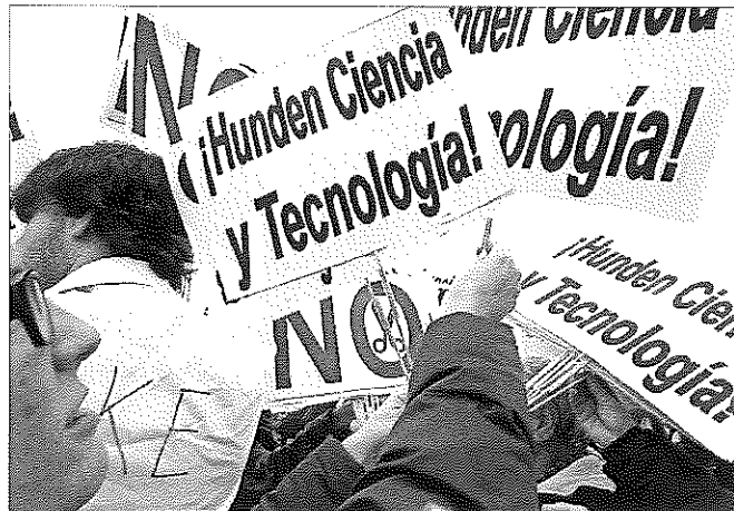
Protesta de científicos por los recortes en diciembre de 2012 en Madrid.

La tendencia a la baja ahonda en las dificultades que atraviesa la mayor institución científica española. En números rojos desde 2009, el Gobierno la rescató el año pasado con una inyección extraordinaria de 95 millones de euros que evitó su quiebra. El CSIC cuenta este ejercicio con un presupuesto de poco más de 600 millones, un 0,1% más de lo presupuestado inicialmente para 2013. Para 2015, los presupuestos siguen congelados, mientras que la tasa de reposición de investigadores, que era del 10% pero no se cubría, será del 50% en 2015. "A ver si se cumple; de entrada significa que siguen mermando el nú-