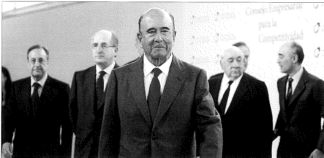
Emilio Botín, en una reunión de Consejo Empresarial para la Competitividad. En la foto, de izquierda a derecha, Florentino Pérez, Antonio Brufau, Isidoro Álvarez y Rafael del Pino.

► 2013. Fusión por absorción de Banesto y Banif.