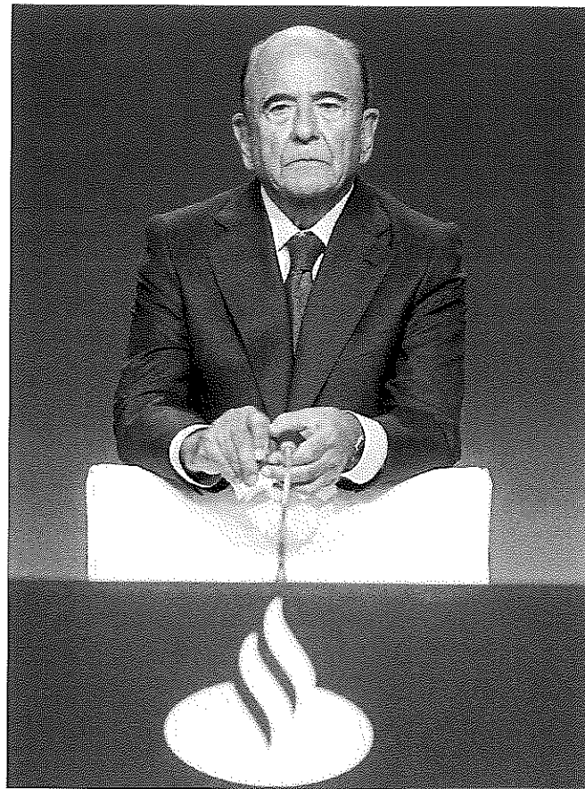
Emilio Botín, en una junta de accionistas del Santander.

La muerte de Botín, quien hubiese cumplido 80 años el próximo 1 de octubre, provocó un retroceso inmediato del valor en Bolsa, donde llegó a caer cerca del 2% —cerró con un descenso del 0,65%— y reacciones de todo tipo sobre su figura y obra en la entidad, en cuyo consejo entró en 1960. Pasó por varios cargos hasta que heredó la presidencia de su padre, Emilio Botín Sanz de Sautuola López, en noviembre de 1986, cuando este contaba con 83 años y él 52, dos menos de los que tendrá en octubre la nueva presidenta. Al mismo tiempo, el viejo patriarca dejaba la presidencia de Bankinter a su otro hijo, Jaime, que abandonaría el cargo en 2002 para centrarse en tareas privadas. El mayor de los Botín, sin embargo, prefirió seguir al pie del cañón. La edad no era impedimento para estar en primera línea de fuego. Y aunque no estaba pensando en el relevo, había mostrado sus preferencias por su hija Ana.