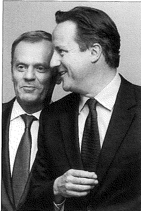
Los primeros ministros de Polonia, Donald Tusk (izquierda), y Reino Unido, David Cameron, ayer en Bruselas.

El pacto tácito entre el francés François Hollande, el italiano Mario Monti y el español Mariano Rajoy logró arrancar a la alemana Angela Merkel un parque para el crecimiento y el empleo de 120.000 millones de euros que debería gastarse en