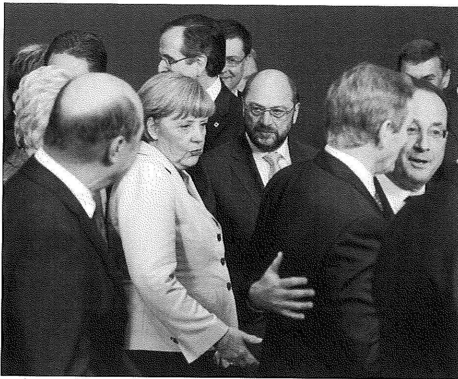
La canciller alemana, Angela Merkel, y el presidente francés (derecha), junto a otros líderes europeos, ayer en Bruselas.

Europa sigue esperando a su Roosevelt (el presidente que sacó a EE UU de la Gran Depresión), pero la economía y la política tiran en direcciones distintas. Mientras la economía exige ambición para arreglar el edificio del euro y medidas a muy corto plazo para la reactivación, los socios euro-