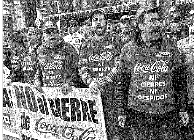
Una protesta de trabajadores de Coca-Cola ante la sede del PP en la calle de Génova, en Madrid.

Puede la empresa reincorporar a los despedidos en otras plantas de otras comunidades autónomas? Los servicios jurídicos de CC OO creen que quedó muy claro que no. Cuando se publicó el auto el pasado 21 de noviembre, los abogados de los trabajadores advirtieron que "si la empresa optara por la readmisión expresa y trabajo efectivo, y no por la exoneración de trabajar con pago de salarios, esta debe-