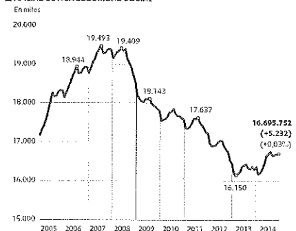
■ AFILIADOS A LA SEGURIDAD SOCIAL