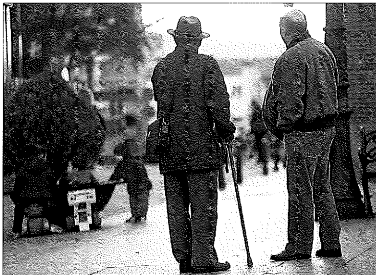
Dos jubilados, en Manzanares el Real (Madrid).