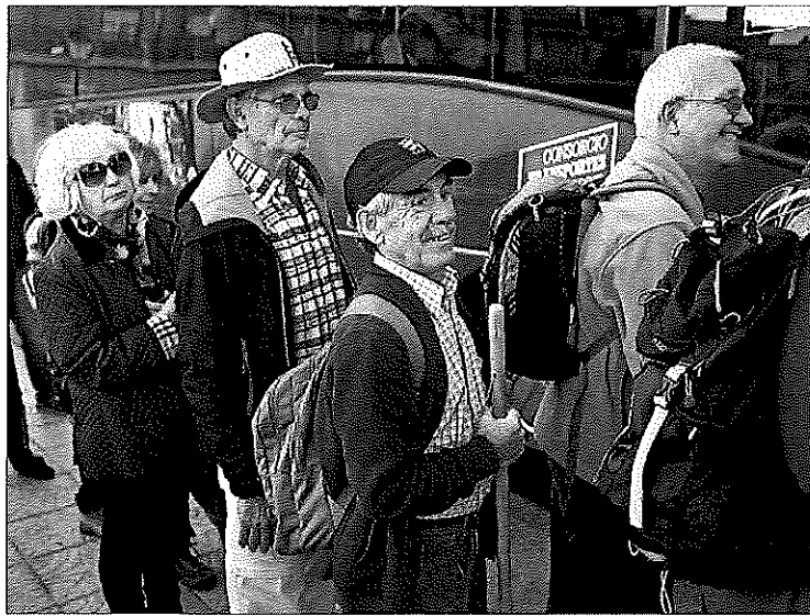
Jubilados de Manzanares el Real (Madrid), esperando un autobús para una excursión.

El dinero dispuesto el pasado diciembre no ha sido el único utilizado del fondo de reserva este año. Ya en julio gastaron otros 3.750 millones. Entonces la Seguridad Social también recurrió al excedente de la gestión de mutuas que se acumula en otro fondo, exactamente 2.780 millones. En total, entre las tres disposiciones en 2015 Empleo ha tenido que desembolsar 14.280 millones para pagar las pensiones, ya que lo ingresado por cotizaciones (la vía abrumadoramente más abundante de los ingresos ordinarios) es insuficiente para hacer frente.