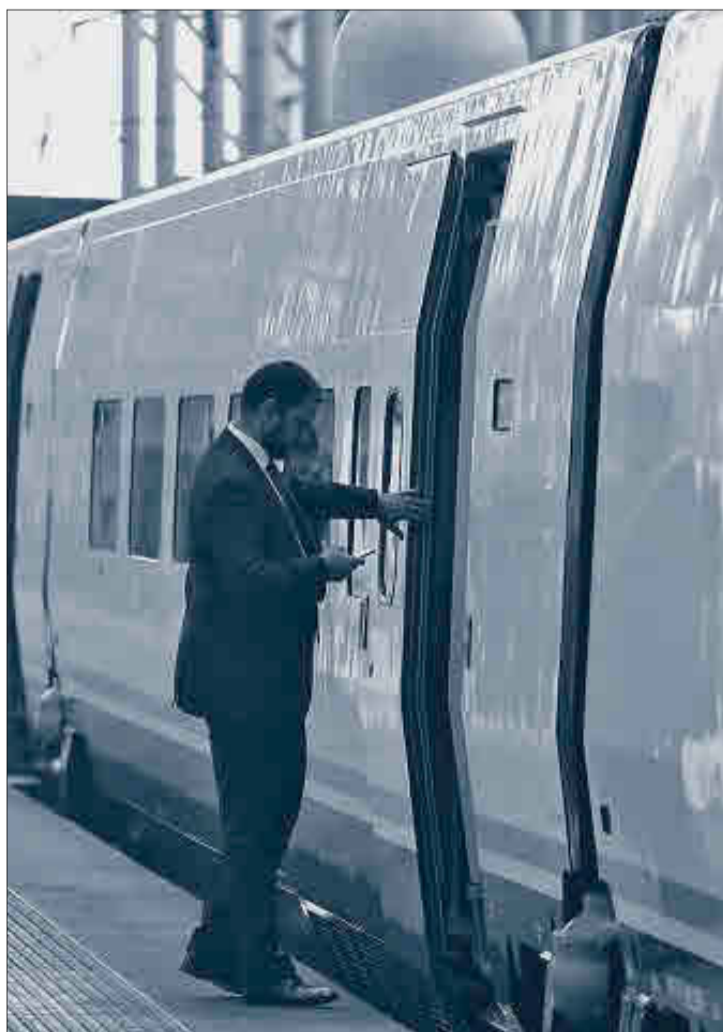
Un hombre accede al interior de un vagón de tren de Renfe.

La cara B de este plan +Renfe ha sido provisionar en 2015 un total de 49,8 millones para el plan de bajas voluntarias puesto en mar-