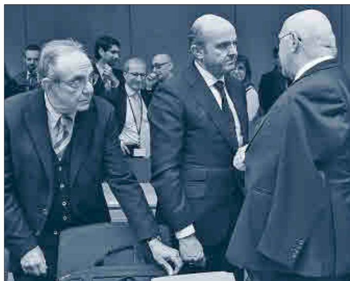
De izda. a dcha., P.C. Padoan, De Guindos y M. Sapin en Bruselas.

Sin embargo, lo cierto es que en las últimas semanas las voces de alarma se han multiplicado. Primero fue el presidente de la Comisión, Jean-Claude Juncker, y en los últimos días el presidente del Eurogrupo, Jeroen Dijsselbloem y el comisario Económico, Pierre Moscovici.