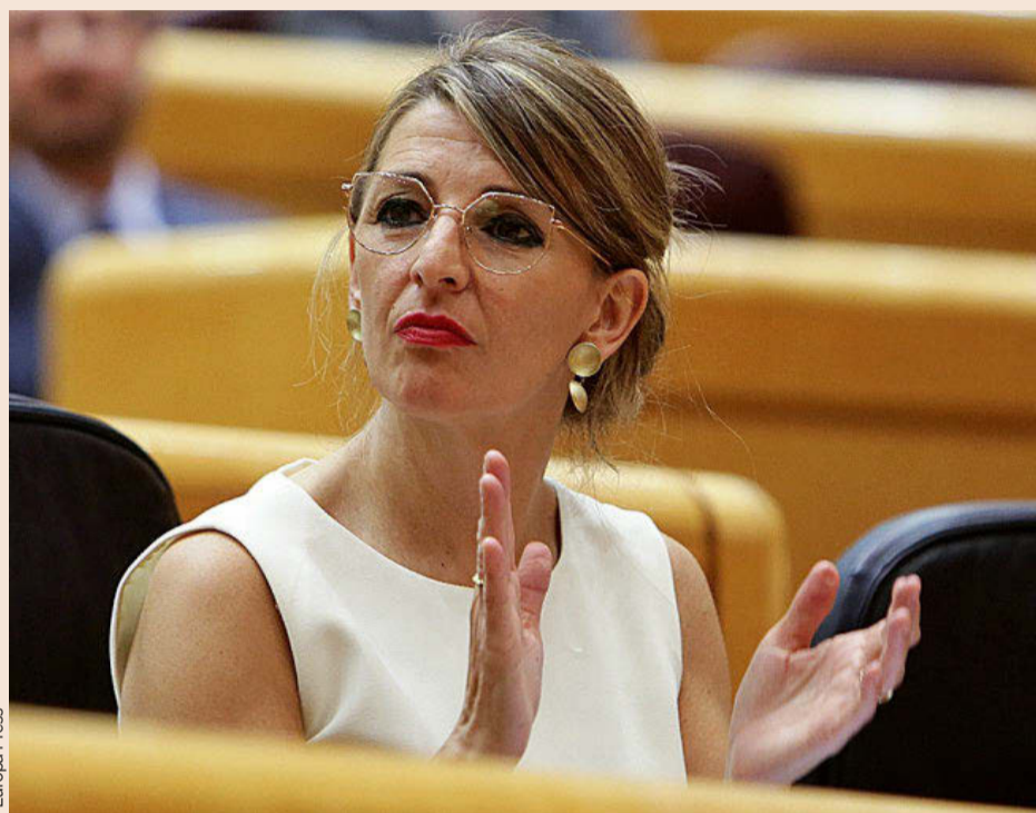
La ministra de Trabajo y Economía Social, Yolanda Díaz.

negociando con la patronal y los sindicatos la prolongación más allá de este mes de los ERTE con estas medidas. Ya el 11 de mayo, en el Palacio de la Moncloa, el presidente del Gobierno, Pedro Sánchez, firmó un acuerdo con los empresarios y los sindicatos para prolongar los ERTE hasta el 30 de junio.