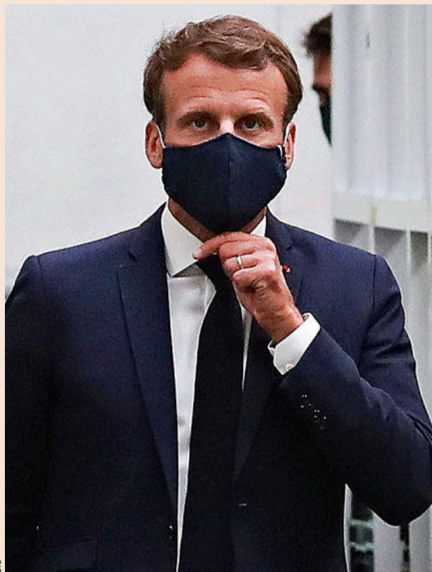
El presidente francés, Emmanuel Macron.

El PIB español podría hundirse aún más; en su última revisión, el Banco de España ha previsto que, en el mejor de los escenarios, la contracción de la economía española será de un 9% aunque, en el peor de los escenarios, la debacle podría alcanzar el 15,1%. Todas estas previsiones tienen un elemento en común: la confianza de que el año que viene se producirá un rebote que, si bien no supondrá la vuelta a la situación económica anterior, contribuirá a aliviar la crisis. En ese sentido, el