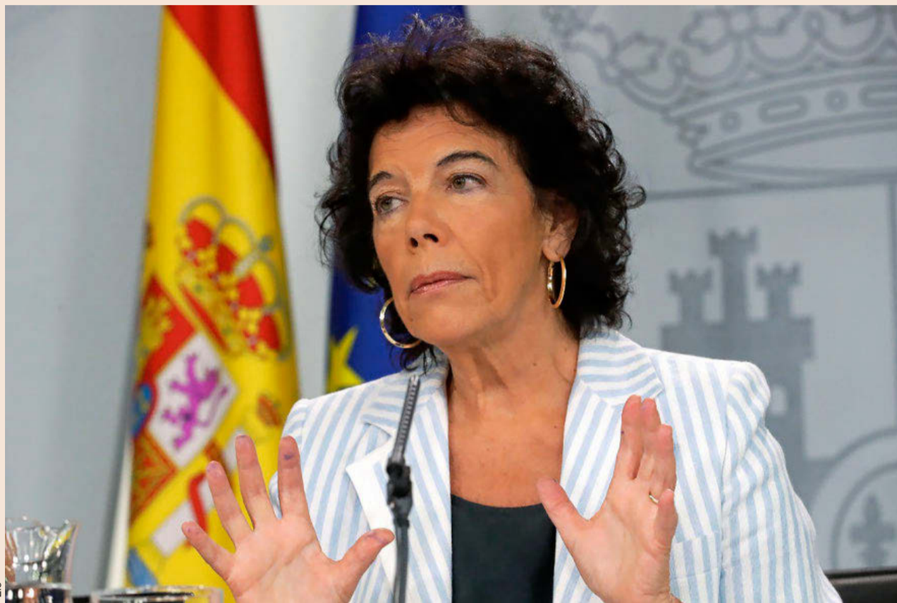
La portavoz del Gobierno y ministra de Educación, Isabel Celáa, el pasado viernes tras el Consejo de Ministros.

Los efectos de que los jóvenes españoles dejen de formarse, abandonen o sufran fracaso escolar se perciben en