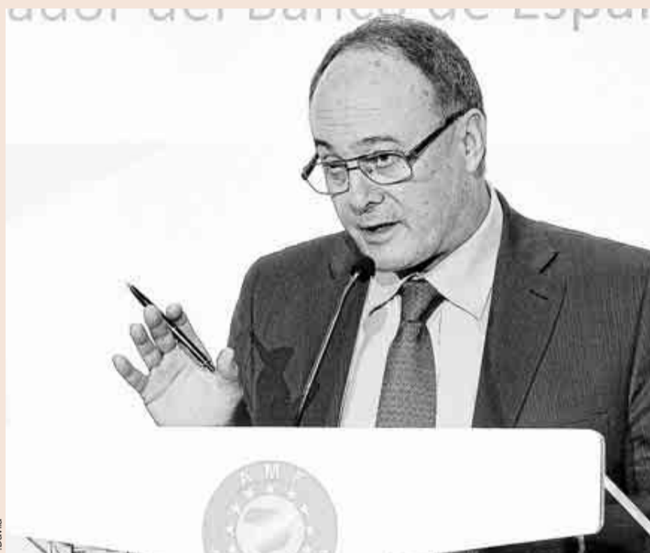
El gobernador del Banco de España, Luis María Linde.

El supervisor financiero también se ha felicitado por el "entorno de estabilidad de precios". "La desaceleración