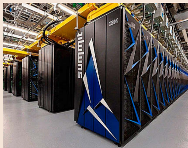
Ordenador Summit de IBM.

Google ha donado 22,5 millones en crédito publicitario a la OMS y agencias gubernamentales