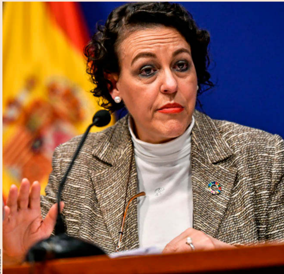
La ministra de Trabajo, Migraciones y Seguridad Social, Magdalena Valerio.

En segundo lugar, la recaudación también descendió, en menor medida, porque Telefónica terminó de abonar su expediente de regulación de empleo al SEPE en 2016. Hay que tener en cuenta que, hasta ese año, los trabajadores de la compañía de telecomunicaciones representaron el 72% de los 9.215 trabajadores cubiertos en los expedientes. De la misma forma, de los 368 millones de euros reclamados