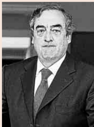
El presidente de la CEOE, Juan Rosell.

“No creo que los trabajadores fijos acepten condiciones en beneficio de los temporales”