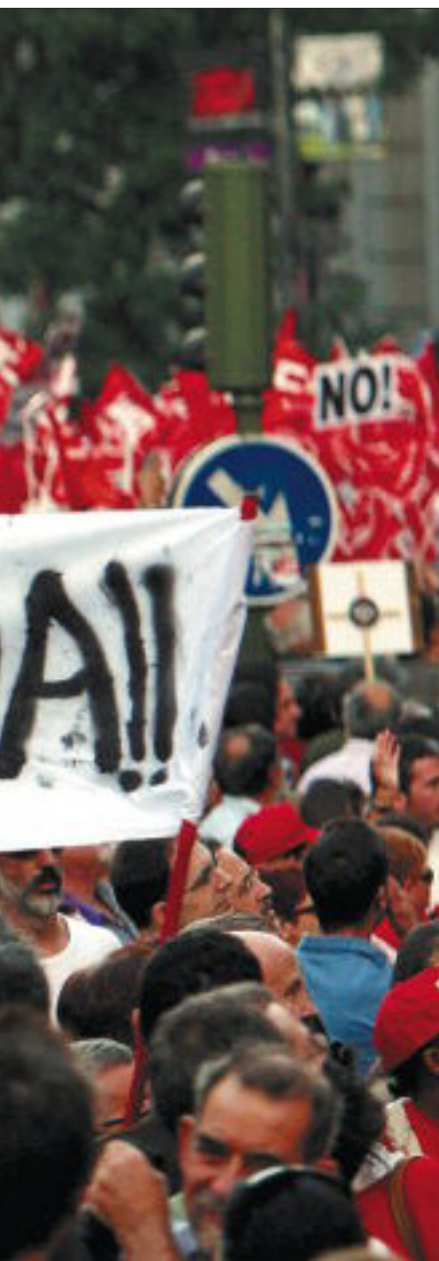
Imagen de la manifestación de Madrid a su paso por la plaza de Cibeles.

► Otros: Los sindicatos calculan un seguimiento casi total en los servicios de limpieza y de recogida de basuras (96%), y en Correos (90%).