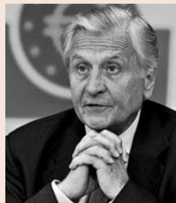
El presidente del BCE, Jean-Claude Trichet.

Demanda un "órgano asesor de sabios" para vigilar las estadísticas