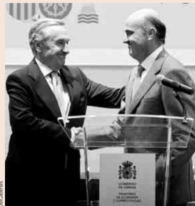
El presidente de la CNMC, José María Marín, y el ministro de Economía, Luis de Guindos, ayer durante la toma de posesión del primero como presidente del nuevo superregulador.

Para Marín Quemada, la economía española ha superado la "complicada situación" que presentaba hace un año gracias a las reformas.