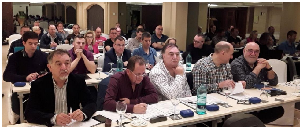
Los miembros del Comité Ejecutivo y compromisarios de las distintas organizaciones de la Federación de Metal que llenaron el salón del hotel Zenit Don Yo donde se celebró el Comité

La Federación de Metal está formada por más de 20 organizaciones de los sectores de la automoción y siderurgia que celebraron los positivos resultados de 2017, y las buenas expectativas de que España se convierta en pionera en la fabricación de vehículos eléctricos vaticinando una fuerte implantación en la próxima década