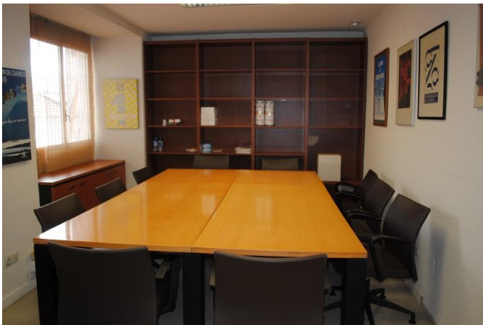
Dependencias de las SALAS de la 1ª Planta a las que se ha dotado de nuevos muebles y material de trabajo

Dentro del nuevo mobiliario, también se ha adquirido un armario inifugo de seguridad destinado a guardar y proteger material más sensible y, además, responde a las exigencias de la Ley de Protección de Datos. Este mueble (que lo podemos ver en la fotografía de abajo) está a disposición de todas las Federaciones de CCP.