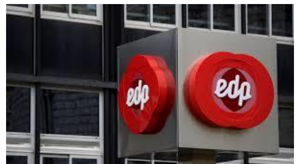
Sede de EDP

Con estos nuevos delegados, tanto en EDP Comercializadora en Madrid como en EDP España en Castejón, ACYP-EDP representa una tendencia de crecimiento que permite refor-