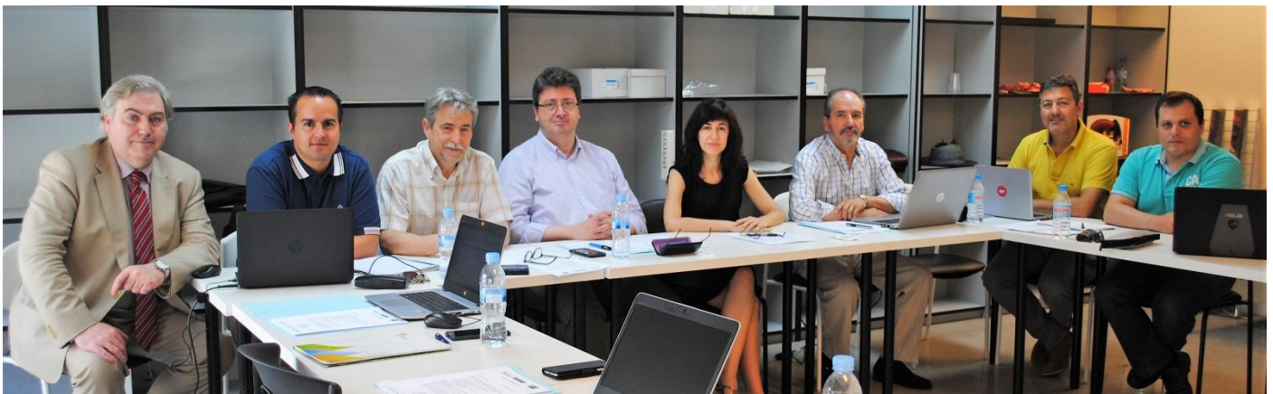
Reunión del Comité Ejecutivo de FECSE con todos sus miembros

La Federación Española de Cuadros de la Energía (FECSE) celebró, el 26 de junio de 2018, un Comité Ejecutivo que tuvo lugar en la sede de Confederación de Cuadros y Profesionales (CCP).