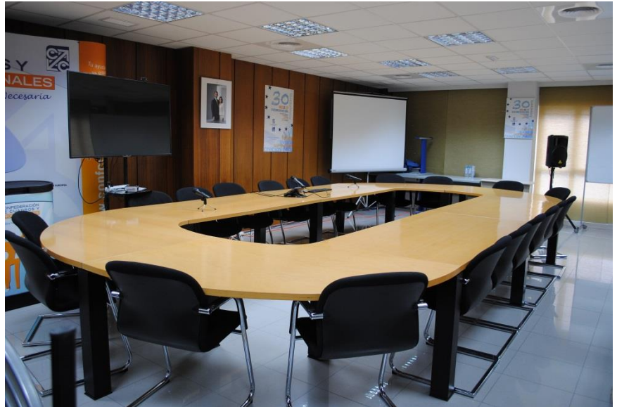
SALÓN DE ACTOS, 2ª Planta del edificio de CCP en Madrid

El Salón de Actos, se ha convertido en una gran sala, dotada de grandes medios tecnológicos con los que se pueden hacer videos conferencias y celebrar reuniones con una magnífica sonorización y capacidad para un gran número de personas. A esto hay que añadir la sensacional mesa presidencial incorporada recientemente.