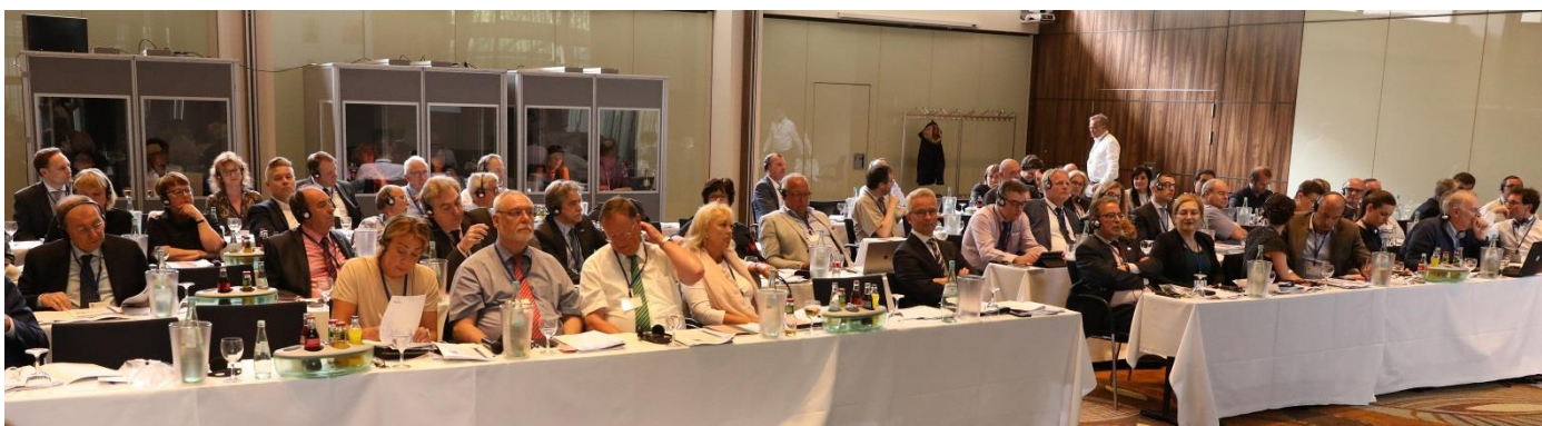
Los miembros de CEC que asistieron al Congreso y al seminario, entre los que se encuentra la delegación española de CCP ( segunda fila por la izda.)