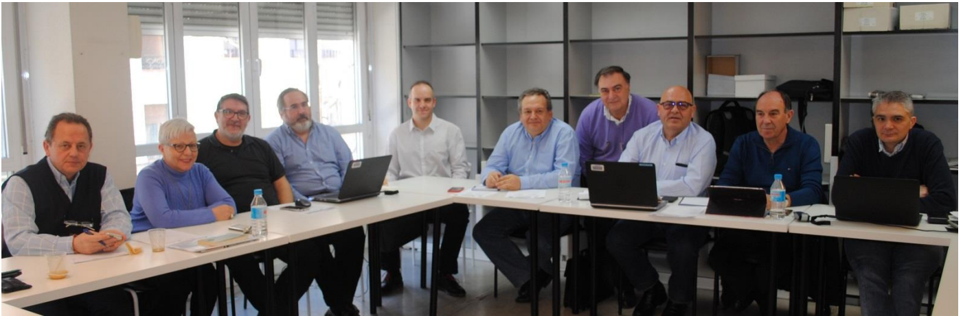
Los miembros del Comité Ejecutivo de la Federación de Metal durante la celebración del Comité

La Federación de Metal de Confederación de Cuadros y Profesionales (CCP) celebró el Comité Ejecutivo correspondiente al primer trimestre del año 2018, el 16 de marzo, en los locales de CCP en Madrid, en el que estuvieron presentes la mayoría de los representantes de las empresas de automoción y siderurgia instaladas en España.