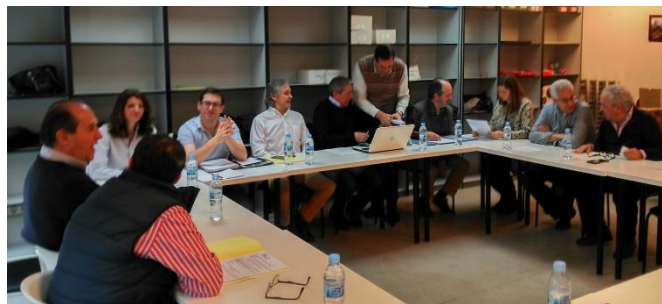
Asamblea de SITAT

Se encuentra ya constituida la mesa negociadora y se dio a conocer el número de miembros con los que cuenta SITAT dentro de esta mesa. Una de las novedades de las negociaciones es la presentación de una plataforma conjunta integrada por los sindicatos UGT, CCOO y SIE y a la que se suma SITAT. Esta plataforma fue anunciada en la última reunión celebrada el 5 de abril.