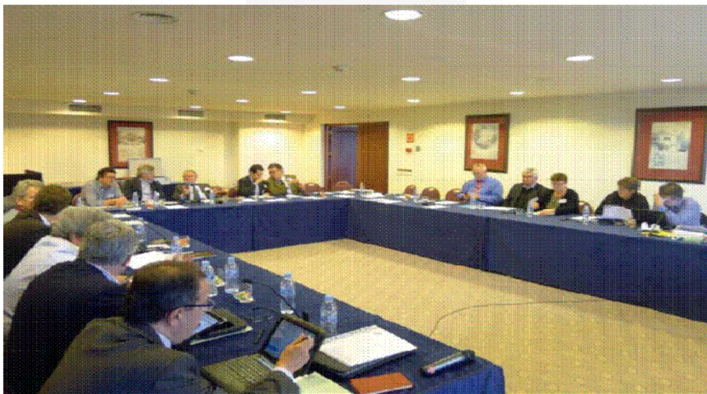
Un momento de la reunión del Consejo Ejecutivo de la CEC en Mallorca

Estos dos documentos se terminarán y serán votados por los miembros del Comité Directivo de la CEC durante el encuentro tradicional de primavera del 24 Abril.