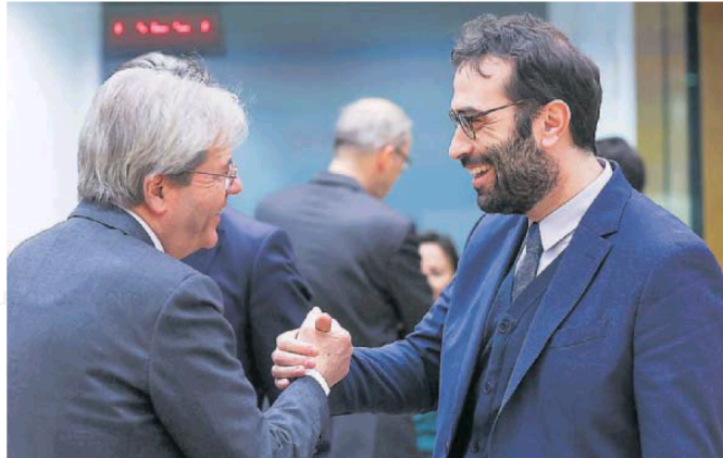
El ministro español de Economía, Carlos Cuerpo (derecha) estrechaba la mano del comisario europeo de Economía, Paolo Gentiloni, en Bruselas el 15 de enero.

El resto de las proyecciones macroeconómicas muestran un escenario algo peor que el casi idílico aterrizaje previsto en marzo. La mediana de las previsiones apunta a una inflación del 2,6%, dos décimas más alta que la anterior, aunque se mantiene el crecimiento en el 2,1% y la tasa de paro en el 4% para final de año.