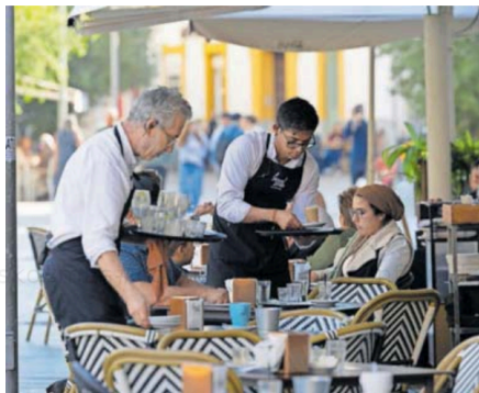
Camareros en la terraza de un bar de Sevilla, el 23 de octubre.

Es así que el salario medio se situó en los 23.981 euros en 2023, frente a los 22.781 del año anterior, cuando ya se había producido un incremento del 5,8%, según el organismo dependiente del Ministerio de Hacienda. De hecho, el aumento de las retribuciones de 2022 fue el más marcado de los últimos 15 años. Solo lo supera el alza del 7,4% de 2007, cuando la economía era boyante, la inflación estaba controlada y aún no se vislumbraba la devastación que provocaría el crack financiero. La economía española sigue creciendo con vigor —mucho