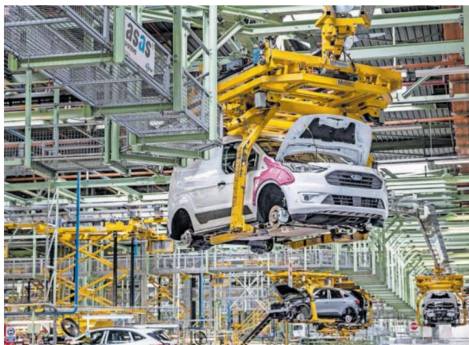
Fábrica de Ford en Almussafes (Valencia) en 2022.