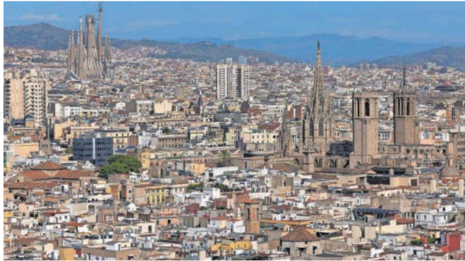
Vista de Barcelona desde el edificio Colón.

La gran mayoría de permisos se concedieron en las provincias de Madrid (86.410 permisos en total) y Barcelona (77.678). Pero hay diferencias, en Madrid el principal perfil es del de personal directivo o altamente cualificado, a mucha distancia de los inversores. Y las dos principales procedencias son América central y del sur y