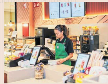
Empleada en una franquicia de cafeterías.

La entidad hace un llamamiento con esta investigación al Congreso de Estados Unidos para que apruebe la Ley de Aumento de Salarios elevando el salario mínimo federal, al menos, hasta 17 dólares la hora.