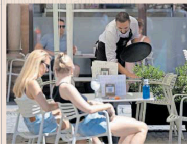
Un camarero sirve en un terraza de Sevilla.

Por su parte, el vicesecretario general de Política Sindical de UGT, Fernando Luján, insistió en la necesidad de que "el registro de jornada sea fiable y recoja las horas reales" y que las extraordinarias se retribuyan como mínimo a un 125% de la retribución ordinaria, como reclama la Carta Social Europea. Por ello el sindicato ha interpuesto una reclamación ante el Comité Europeo de Derechos Sociales, ya admitida a trámite. "No es tolerable que haya más de seis millones de horas trabajadas que ni se registran ni se abonan".