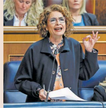
La vicepresidenta primera y ministra de Hacienda, María Jesús Montero, ayer, en el Congreso de los Diputados. EFE

Aunque las comunidades gobernadas por el PP, que son la mayoría —11 de 15—, manifestaron su rechazo a la condonación, no se espera un plantón en estas primeras reuniones. El recelo de los barones populares se debe sobre todo a la forma en la que ha visto la luz la propuesta de quita, que nace de un acuerdo entre ERC y el