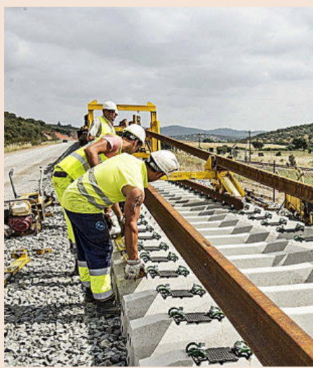
El tren copará el 41% de la inversión.

realicen actuaciones inversoras en materia de transportes, como Adif, que percibirá 675 millones de euros, Adif-Alta Velocidad (1.285 millones) o Seittsa, dedicada a las carreteras (154 millones), mientras que otras se destinarán a Enaire (29 millones), Renfe Viajeros (13 millones) o Puertos del Estado, 140 millones de euros. Por áreas de actuación, las obras en carreteras concentrarán un gasto de 989 millones de euros, junto con otros 1.033 millones para la conservación viaria. Tras el ferrocarril, las mayores partidas de gasto irán para las infraestructuras de puertos, 1.003 millones, aeropuertos, 1.059 millones, la Hidráulica, 766 millones, y la de Costas y Medioambientales, 229 millones.