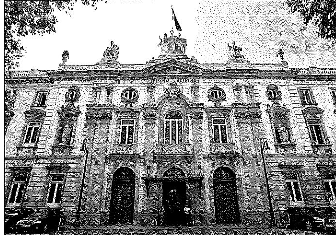
Fachada de la sede del Tribunal Supremo.

El directivo de Iberdrola aseguró que, a pesar de que existían numerosos riesgos, recomendó apostar por Bankia al ser un "proyecto atractivo con la primera o segunda entidad a nivel nacional, con mercados de elevadas rentas en Madrid y la Comunidad Valenciana, despojado de herencias políticas, y que ofrecía un descuento del 50% en su precio".