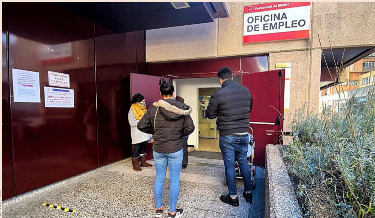
Personas demandantes de trabajo delante de una Oficina de Empleo en Madrid.

“Esta diversidad normativa –dice el informe de finales del año pasado– implica hasta siete definiciones diferentes de unidad familiar, y supone una gran complejidad para la tramitación y, por ende, para la automatización [del proceso], al tener cada prestación y subsidio unos requisitos especifi-