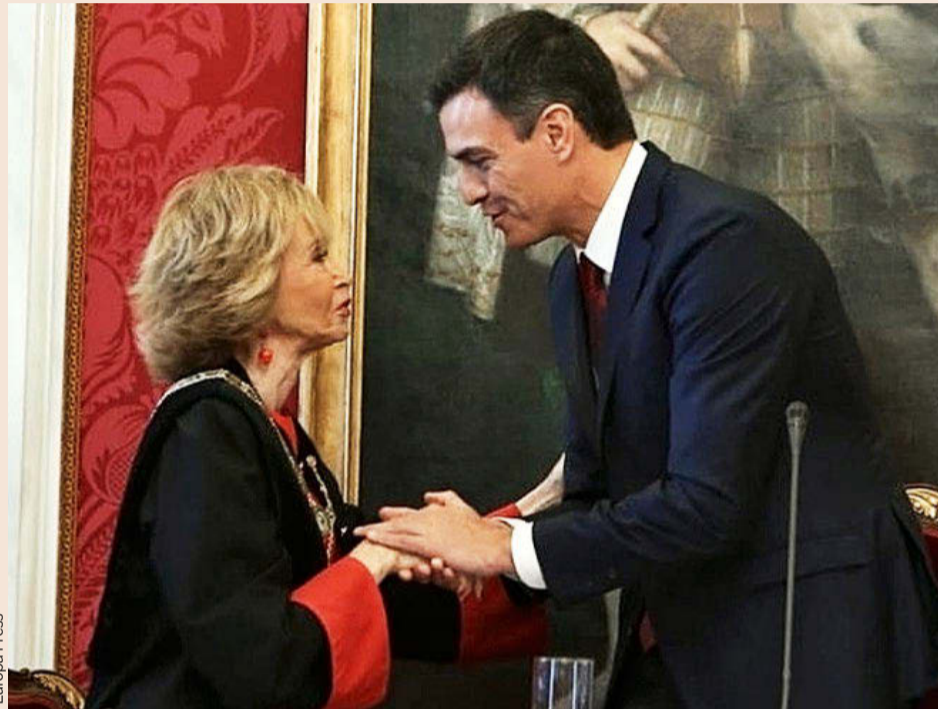
Pedro Sánchez felicita a María Teresa Fernández de la Vega como presidenta del Consejo de Estado.

A ello considera que hay que añadir una memoria del impacto presupuestario de las medidas previstas, aspecto de especial relevancia, destaca. “Es claro que la memoria re-