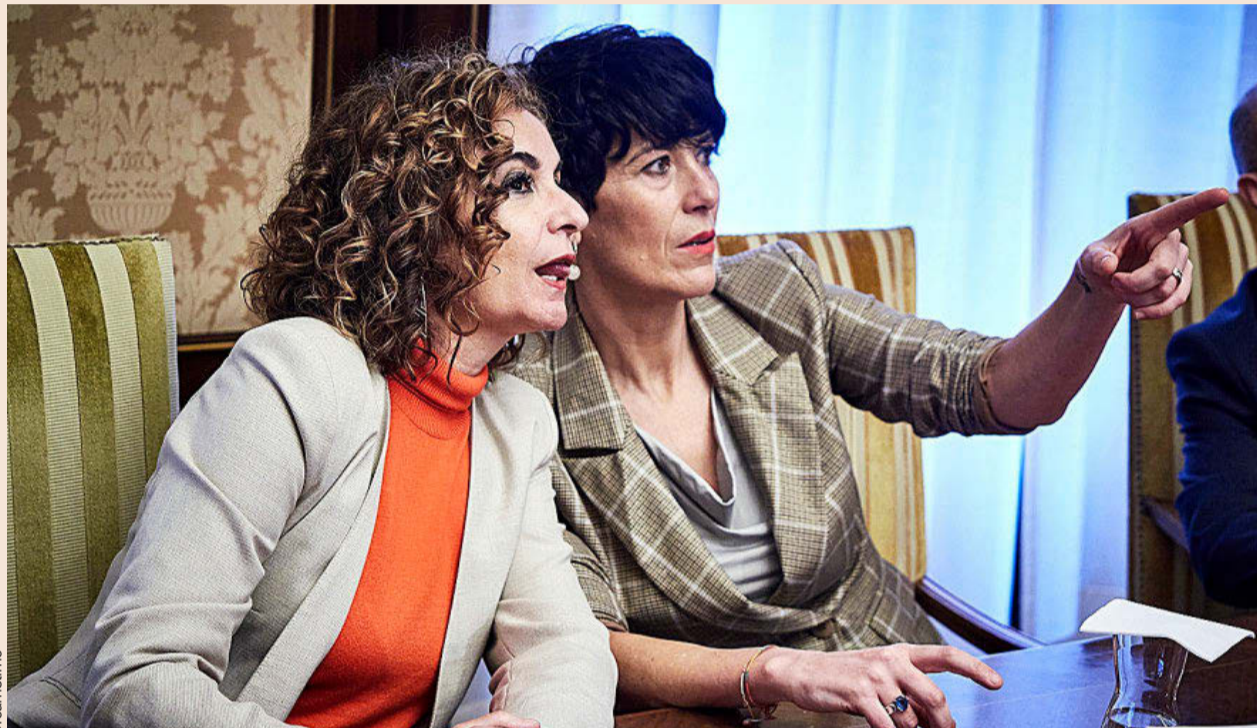
La vicepresidenta y ministra de Hacienda, María Jesús Montero, y la ministra de Inclusión y de la Seguridad Social, Elma Saiz.