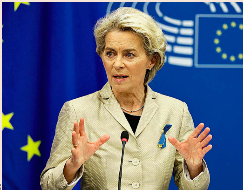
La presidenta de la Comisión Europea, Ursula von der Leyen.

Un funcionario de la UE declara: “El instrumento debía tener un alcance específico, para hacer frente al riesgo de fragmentación en el mercado único en caso de [una] crisis a gran escala. Ahora se está convirtiendo en un pulpo de la economía planificada, imaginando que puede exten-