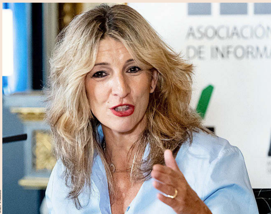
Yolanda Díaz, vicepresidenta segunda y ministra de Trabajo y Economía Social.

Además, la norma quiere facilitar la inserción laboral de los parados de larga duración, y de los jóvenes sin formación, que a veces son lo mismo. Un parado de larga duración es el que lleva un año o más sin encontrar trabajo. En este grupo también están las personas de edad avanzada dentro del mercado laboral, como, por ejemplo, los mayores de 45 y 50 años. Trabajo también ayudará a los contratos de investigación y predoc-