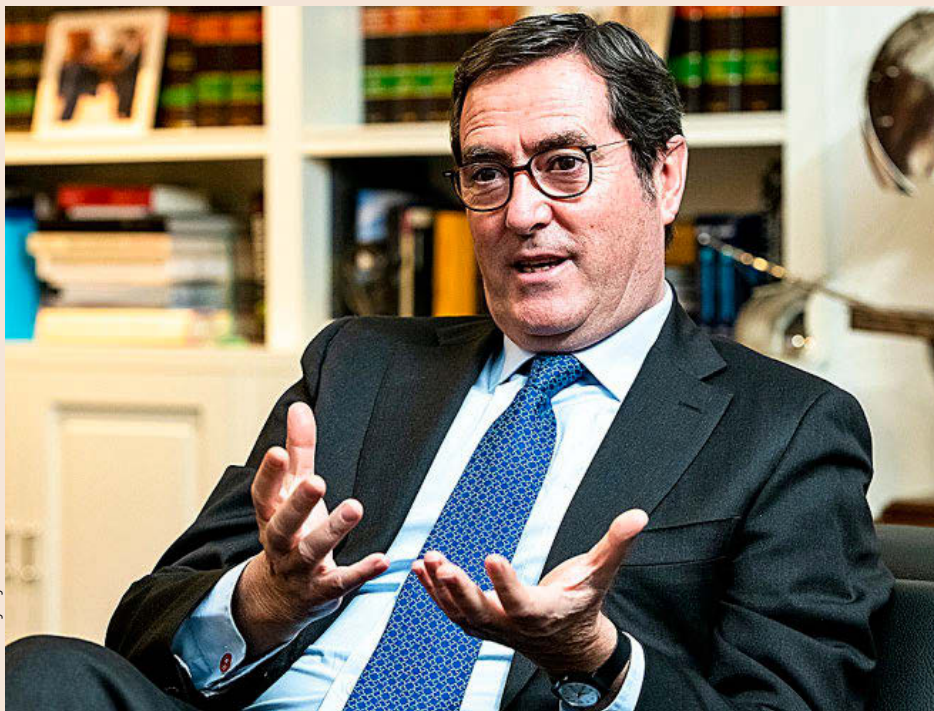
El presidente de la CEOE, Antonio Garamendi, en la entrevista con EXPANSIÓN.

En este contexto, Garamendi ya ha llamado a los secretarios generales de UGT, Pepe Álvarez, y CCOO, Unai Sordo, para concertar una primera cita en la que empezará a hablar de un pacto salarial con una duración de dos o tres años. El último acuerdo de este tipo entre los agentes sociales estuvo vigente entre 2018 y 2020. Fue en ese último año cuando estalló la rece-