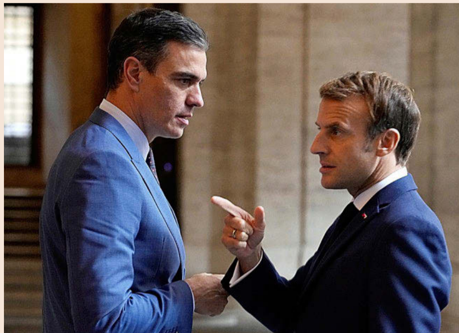
Pedro Sánchez y Emmanuel Macron, presidentes de España y Francia, en un reciente encuentro.

Puede haber nuevas compras en los próximos meses. Vauban Infrastructure Partners , un fondo ligado al grupo bancario Natixis , figura entre los finalistas en la pu-