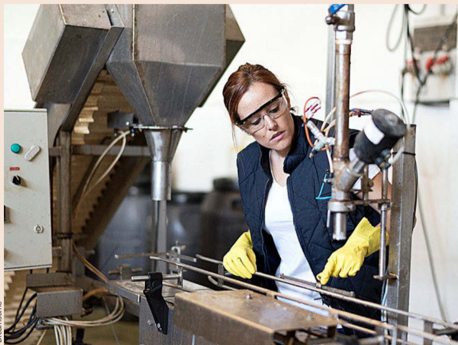
Un 77% de las empresas españolas cree que aumentará sus ventas este año.

En materia fiscal, el 36% considera que la subida de impuestos es una de las amenazas para la economía española en los próximos 12 meses. Sobre el acuerdo al que llegaron en octubre 136 países de la OCDE para establecer un Impuesto de Sociedades mínimo del 15%, solo uno de cada diez directivos que han participado en la encuesta (12%) cree que puede comprometer sus expectativas de crecimiento.