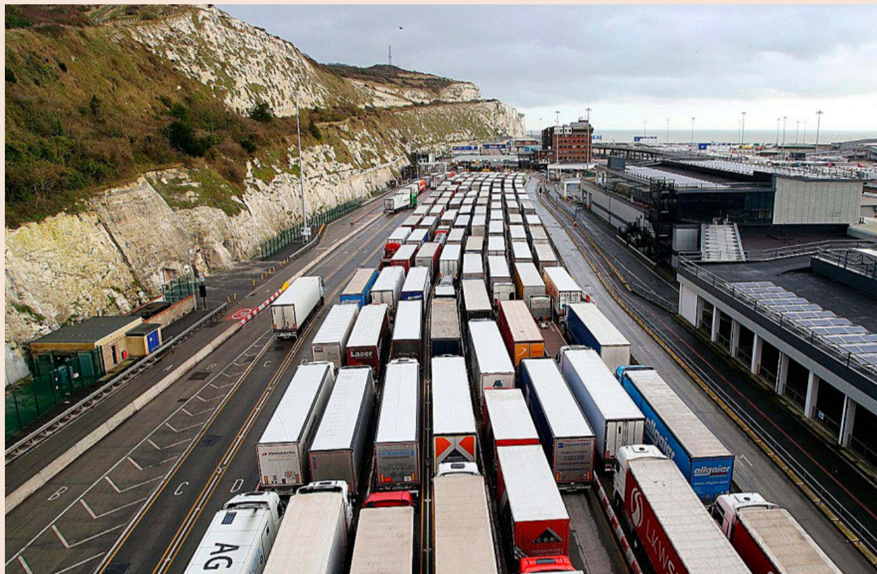
En enero, el comercio bilateral entre Reino Unido y la UE sufrió un duro retroceso en los primeros compases del Brexit.

En concreto, las exportaciones de mercancías y bienes de Reino Unido a la Unión Europea aumentaron un 46,6% en febrero con respecto al mes anterior, hasta 11.600 millones de libras (13.380 millones de euros). Es un repunte considerable sobre todo si se le compara con el histórico desplome de un 42% de enero con respecto a