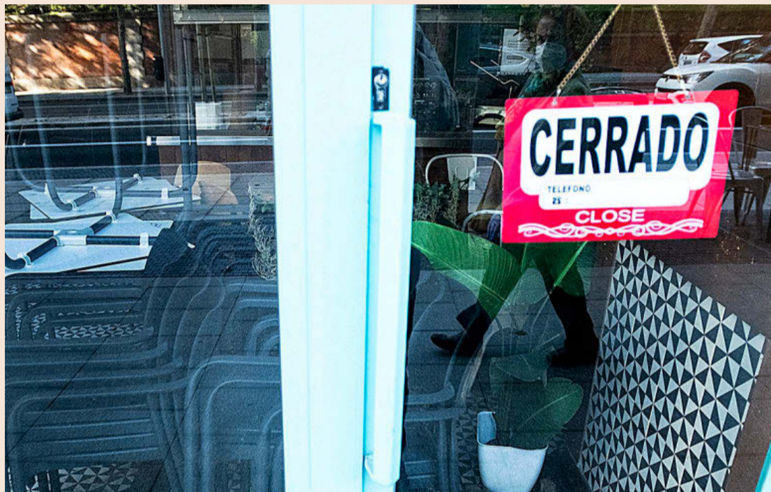
En el primer trimestre de 2021 hubo 24,7 millones de jornadas perdidas por bajas achacables al coronavirus.

Esta cifra parece muy elevada si se compara con el impacto del resto de las enfermedades, ya que supone que las bajas laborales habrían llegado casi a duplicarse en algunos trimestres respecto a los