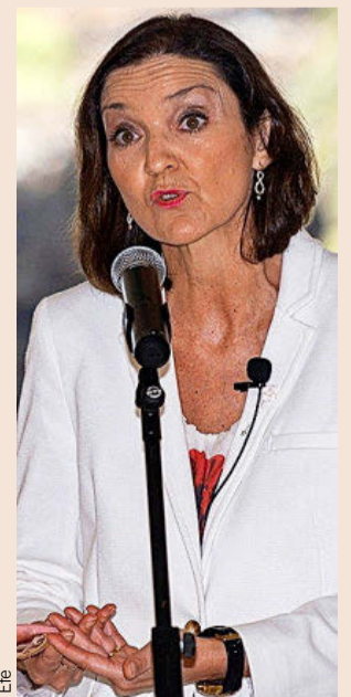
La ministra de Turismo, Reyes Maroto.

En total, habrá un montante mínimo prefijado en determinados casos en función del destino. Por ejemplo, será obligatorio destinar más de 10 millones de euros en gran destino urbano, ocho millones en sol y playa con demanda internacional, tres millones a ciudades con identidad turística y dos millones a destinos rurales costeros, por ejemplo.