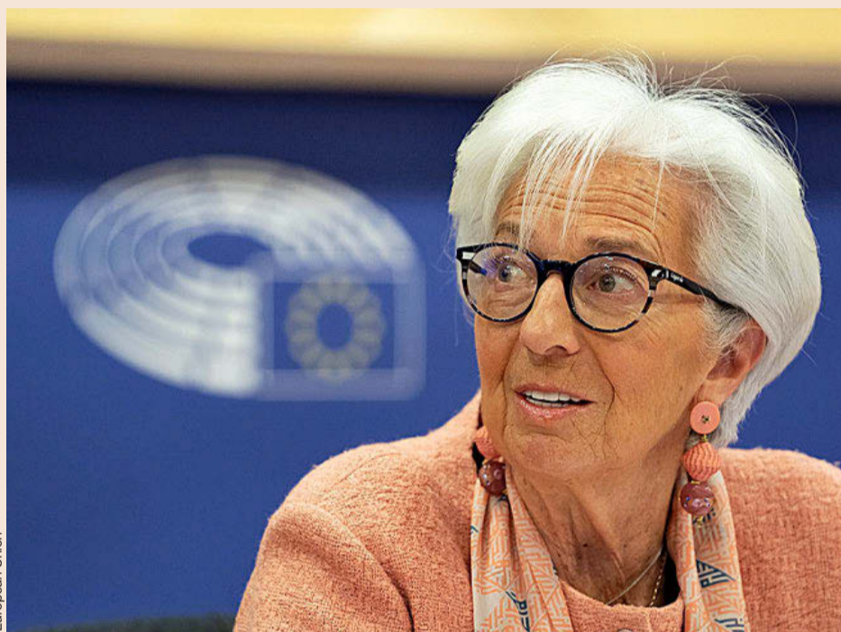
Christine Lagarde, presidenta del BCE, en el Parlamento Europeo.

Algunos expertos consideran que llegar a ese escenario extremo sería el objetivo real de la Administración republicana con su beligerancia económica, a fin de conseguir que todas las empresas que quieren vender en Estados Unidos instalen fábricas en el país o amplíen las que ya tienen como fórmula para revitalizar el deprimido empleo manufacturero. Trump ha logrado en todas las elecciones a las que se ha presentado un enorme apoyo en los Estados con mayor peso de la industria en sus economías con la promesa de reabrir las fábricas que fueron trasladadas a otros países, pero conseguirlo no está siendo tan sencillo como él esperaba. De ahí su beligerancia con los aranceles.