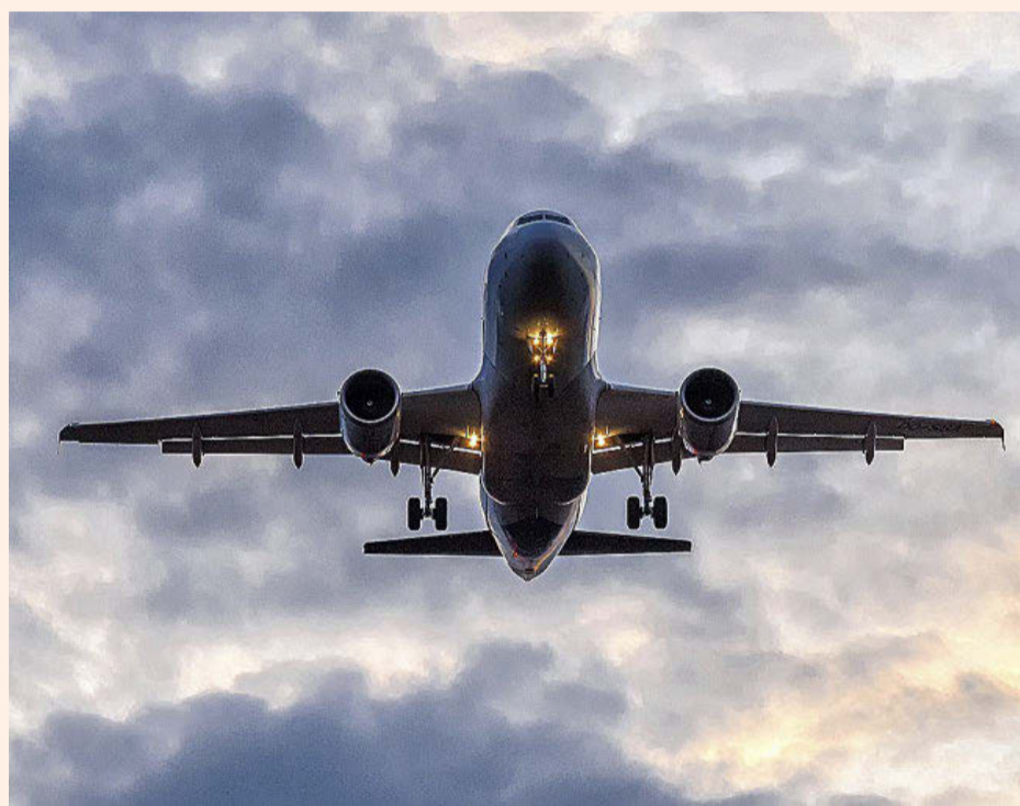
Industrias como aerolíneas, viajes y servicios públicos esperan niveles reducidos de ganancias este año.

● 'Ángeles caídos': el 33% de las compañías españolas espera un crecimiento negativo en los ingresos o beneficios en los próximos doce meses.