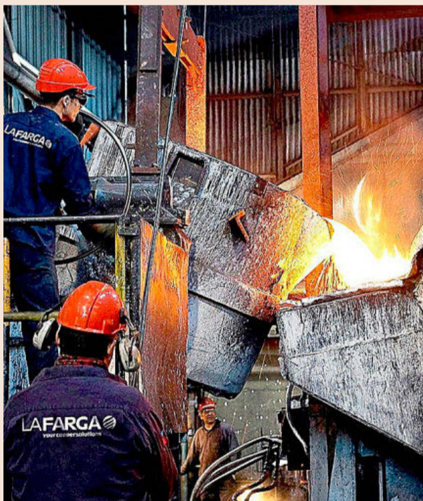
La metalurgia es uno de los sectores más castigados por los precios.

gundos, porque los incrementos de los costes de producción sí que se trasladan, aunque sea parcialmente, a los precios de venta al público, por lo que una escalada de los precios industriales acaba derivando en una vuelta de tuerca al IPC, lo que ahoga el poder adquisitivo de unos hogares ya muy castigados por la subida de la electricidad y de los carburantes.