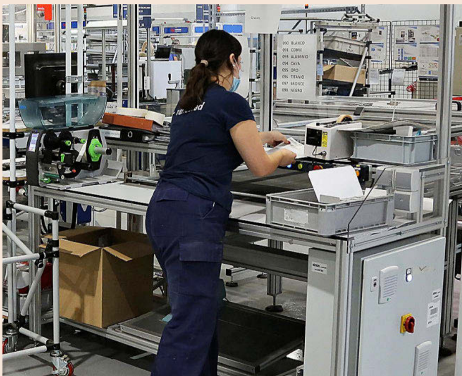
La espiral de los precios merma la competitividad y la capacidad inversora de la industria.

nas no han tenido más remedio que repercutir parte de la subida en los precios al cliente, otras muchas no lo han hecho todavía para no dañar más su posición competitiva en un contexto en el que la inflación crece más en España que en el promedio de la UE, a la que se destina más del 60% de las exportaciones españolas. “Hasta ahora se vienen absorbiendo las subidas, pero eso ya no se puede soportar más”, señalan a EXPANSIÓN fuentes de Confemetal, que califican la subida de los pre-