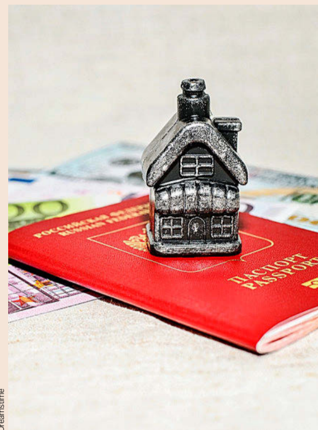
Chinos y rusos reciben el 65% de estos visados.

El dato de ciudadanos rusos que han obtenido un visado a través de esta fórmula podría ser aún más abultado si se tiene en cuenta que ningún nacional de ese país ha recibido uno en el último año. A mediados de marzo del año pasado, la invasión rusa en Ucrania llevó al Gobierno español a poner en suspensión las golden visa para ciudadanos rusos, medida tomada por otros países como Reino Unido. Hasta el estallido del conflicto, era muy habitual la compra de inmuebles por parte de ciudadanos rusos en España, especialmente en enclaves exclusivos del litoral mediterráneo y más en concreto en Cataluña, Comunidad Valenciana y Andalucía. En 2021, 1.280 operaciones de compraventa en España fueron realizadas por rusos, según datos del Colegio de Re-