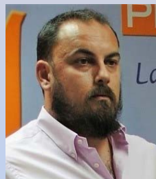
Israel Paredes Pacheco Pdte. Federación Aeronáutica y Aeroespacial